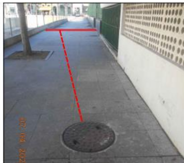
Foto 1 - PV de Águas pluviais onde será conectado o tubo de drenagem da via de acesso.