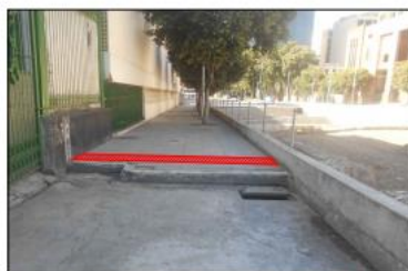
Foto 3 - Local onde será instalada gréu de drenagem - verificar visitas existentes